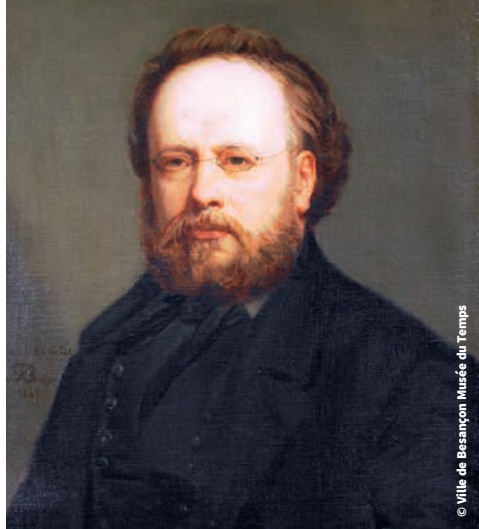
© Ville de Besançon Musée du Temps