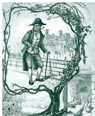
Le vigneron Barbizier